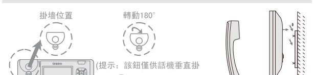
圖2 掛牆 (提示：該鈕僅供話機垂直掛地時使用)